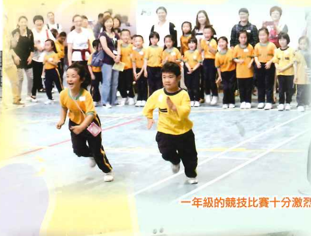
一年級的競技比賽十分激烈