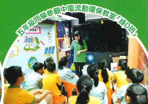
五年級同學參觀中電流動環保教室「綠D班」