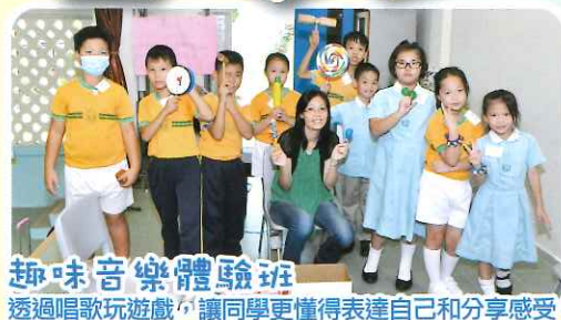
趣味音樂體驗班 透過唱歌玩遊戲，讓同學更懂得表達自己和分享感受。

本校每年均會為全校學生提供音樂、藝術、運動等多元化的課外活動課，讓學生按著自己的興趣發揮所長，令他們有全面均衡的發展。