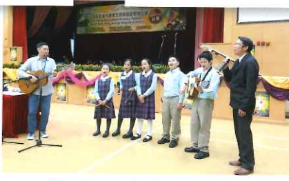
民歌隊獲評判邀請作表演分享