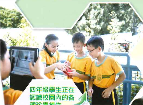
四年級學生正在 認識校園內的各 種珍貴植物