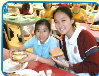
Making tasty sandwiches together at LMST Secondary School. They were wonderful to eat.