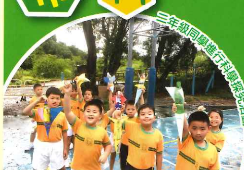
三年級同學進行科學探究活動

本年度著重增加學生的學習經歷，因應各級不同的學習需要在常規課堂中加入專題研習、戶外學習、科學探究及專題講座等活動。下學期考試後設有常識週，學生更有機會參加常識科「中華文化及通識問答比賽」，並在校外及校內進行多元化的活動。