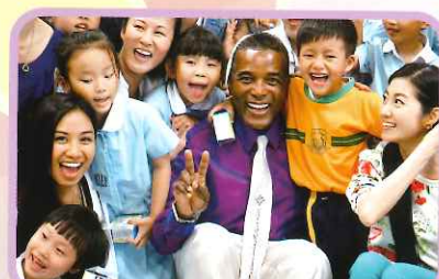
香港藝術與生命教育協會音樂會