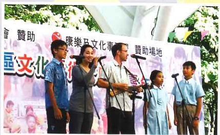
北區文化藝術大匯演