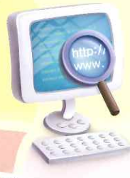
學校新網站，提供校內的最新資訊