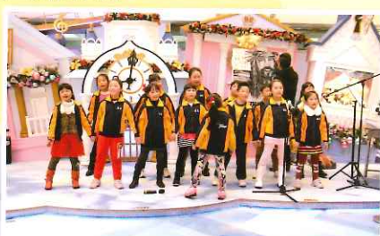
上水廣場聖誕音樂表演