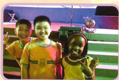
同學參與Watoto非洲兒童合唱團的音樂會，認識不同地方的文化及音樂。