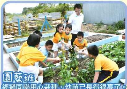
園藝班 經過同學用心栽種，幼苗已長得很高了。