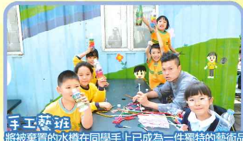
手工藝班 將被棄置的水樽在同學手上已成為一件獨特的藝術品。