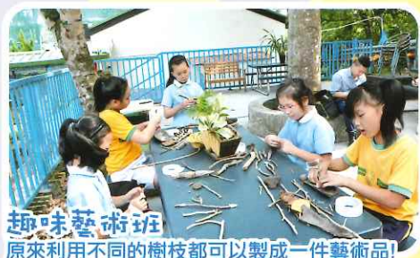
趣味藝術班 原來利用不同的樹枝都可以製成一件藝術品！