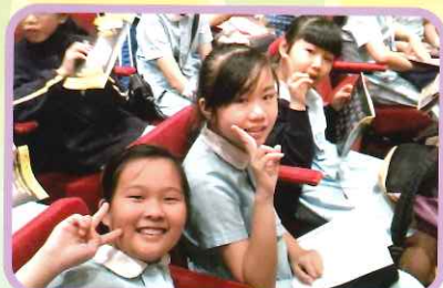
學校文化日欣賞香港管弦樂團表演