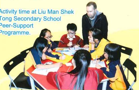
Activity time at Liu Man Shek Tong Secondary School Peer-Support Programme.