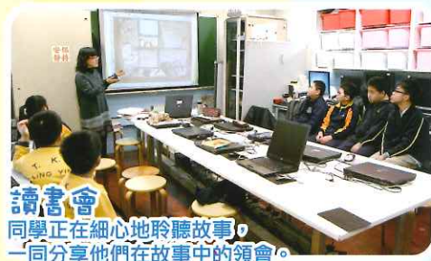
讀書會 同學正在細心地聆聽故事，一同分享他們在故事中的領會。