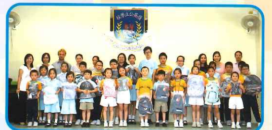
What a fruitful year! Rewards for our diligence!