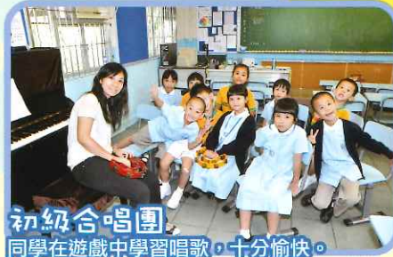
初級合唱團 同學在遊戲中學習唱歌，十分愉快。