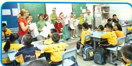
A wonderful Christmas surprise for our students. They played games and received Christmas presents from the mums and children of 'A Box of Hope' initiative.