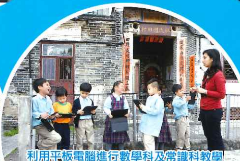
利用平板電腦進行數學科及常識科教學