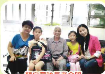
親自家訪長者合照