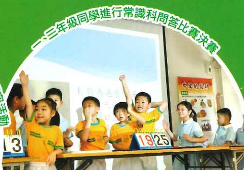
三年級同學進行常識科問答比賽決賽