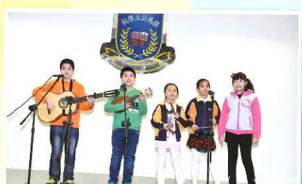
聖誕聯歡會音樂表演