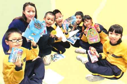
The Doors Foundation visited our school. They held various phonics games and activities for our KS1 students. The children enjoyed this stimulating morning.