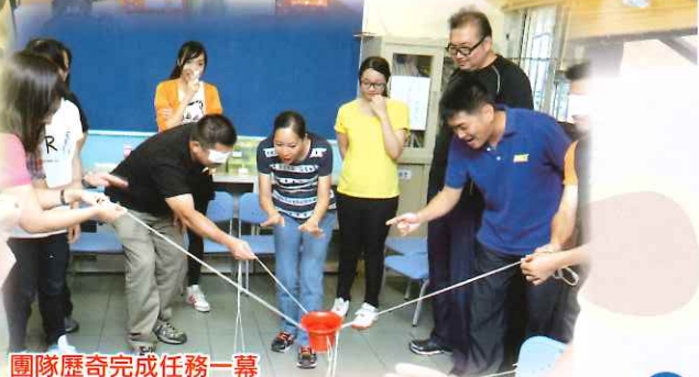
團隊歷奇完成任務一幕