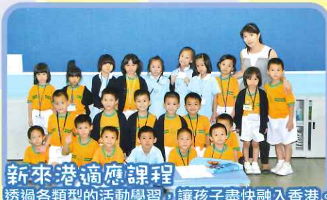
新來港適應課程 透過各類型的活動學習，讓孩子盡快融入香港。