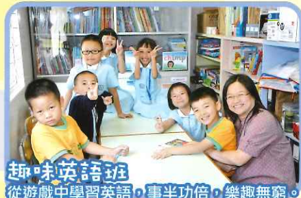
趣味英語班 從遊戲中學習英語，事半功倍，樂趣無窮。