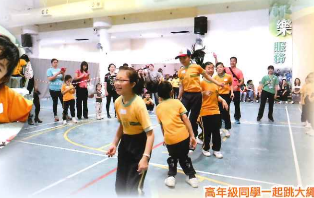
高年級同學一起跳大繩