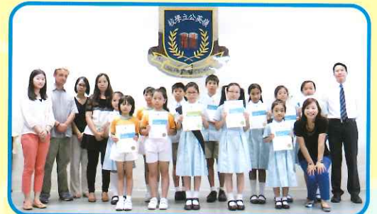
Participants displaying their certificates from the 66th Hong Kong Schools Speech Festival. The standard was high this year and the students performed excellently.