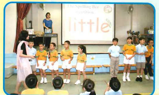
2A and 2B participated in the Spelling Bee Competition. The score was very close.