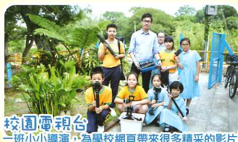
校園電視台 一班小小導演，為學校網頁帶來很多精采的影片！