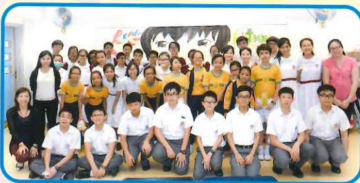
A lot of happy faces at the LMST Peer-Support Programme. Thank you for the fun activities.