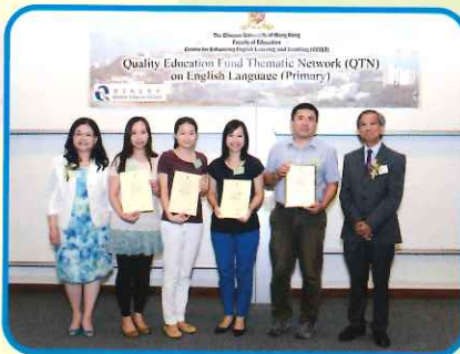
It has been a very rewarding experience for our English teachers who took part in the Quality Education Fund Thematic Network Project which is organized by The Chinese University of Hong Kong.