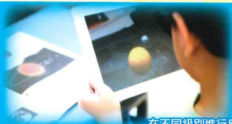
在不同級別進行反轉教室教學

本校的電腦科主要目標是讓學生因應日常生活中的需要，運用資訊科技的能力去解決。電腦科課程是由本校老師自行編寫，以培養資訊素養作藍本，讓學生掌握正確的態度及技巧，正面地使用資訊科技工具，令學生能在这資訊爆炸的時代，獲得他們渴求的知識。從而達成終身學習及能創意解難所需的知識、技能和態度。