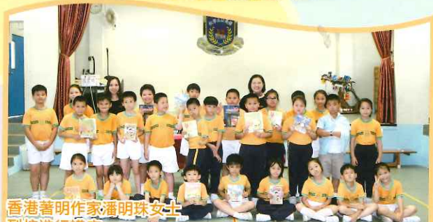
香港著名作家潘明珠女士到校進行講座