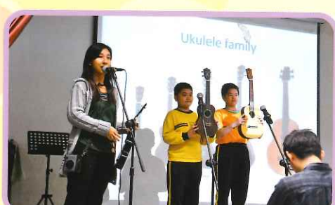
音樂老師早會中分享各類型的音樂