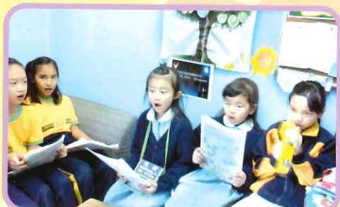
同學早上在社室聚集，一起唱歌，令校園充滿歡樂的歌聲。