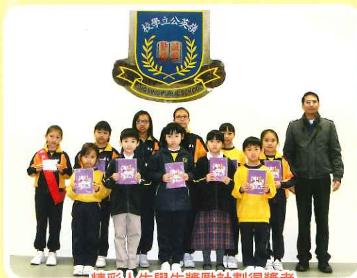
精彩人生學生獎勵計劃得獎者

此計劃鼓勵同學積極投入學校生活，為自己設定目標，然後積極實踐，並在品德、學業、服務及課外活動等方面多元發展。同時透過讚賞和獎勵，強化學生的成功經驗，培養他們正面思維及實踐精神。