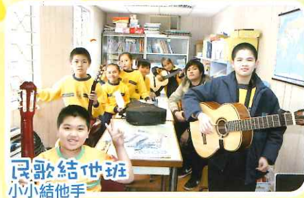
民歌結世班 小小結他手