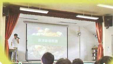
「廚餘知多少及節日減廢」講座

常識科着重培養同學的良好習慣及愛護環境的意識。本年度參與的活動包括有世界糧食「惜飲惜食」日、「香港無冷氣日」、「沖沖五分鐘」等，讓同學學會珍惜及不浪費。另外，為了讓同學認識更多大自然的生態，常識科舉辦了「蚯蚓廚餘堆肥」及「廚餘知多少及節日減廢」講座，讓同學有機會認識生態環境的循環及保護環境的重要。此外，常識科亦鼓勵同學多關心時事，特讓同學有機會與立法會議員面談，參加了「與立法會議員茶聚及暢談」的活動，讓同學擴闊眼界。