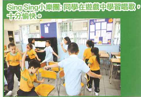
Sing Sing小樂團：同學在遊戲中學習唱歌，十分愉快。