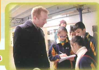
South Island School making a short film with our English Ambassadors