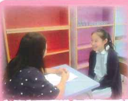
老師與同學進行模擬面試