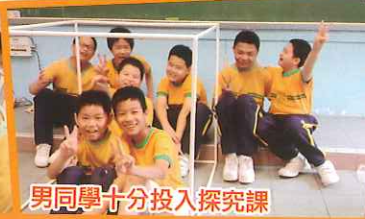
男同學十分投入探究課