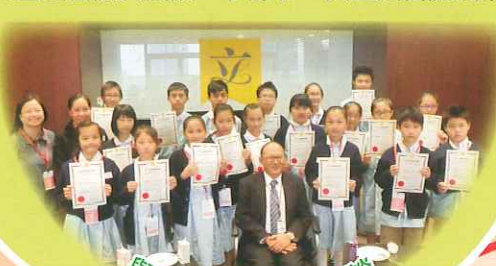
與立法會議員茶聚及暢談