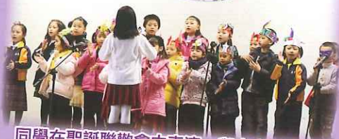
同學在聖誕聯歡會中表演，與大家一起歡度聖誕。