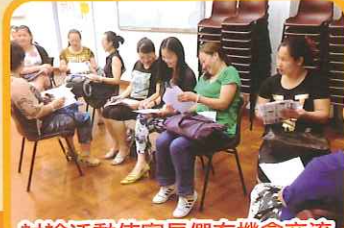
討論活動使家長們有機會交流管教心得