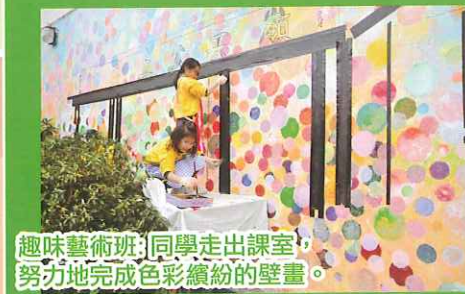
趣味藝術班：同學走出課室，努力地完成色彩繽紛的壁畫。