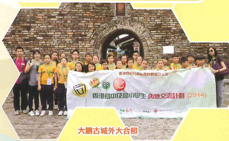
大鵬古城外大合照