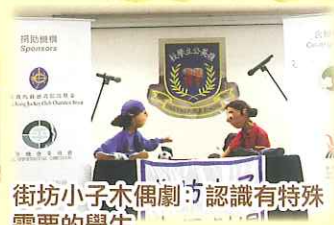
街坊小子木偶劇：認識有特殊需要的學生