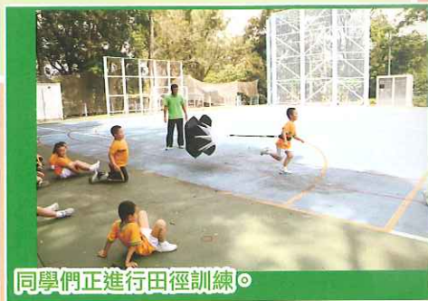
同學們正進行田徑訓練。