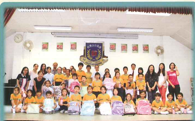
Winners of various English competitions: What a fruitful year!