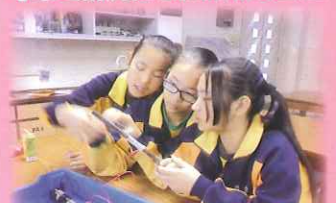
同學體驗中學的科學實驗室