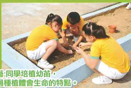
園藝：同學培植幼苗，透過種植體會生命的特點。

本校每年均會為全校學生提供音樂、藝術、運動等多元化的課外活動課，讓學生按著自己的興趣發揮所長，令他們有全面均衡的發展。