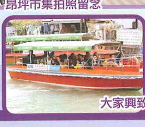
大家興致勃勃的出海觀賞中華白海豚