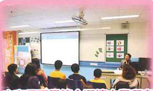
向家長同學簡介選讀中學留意事項