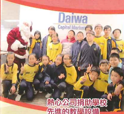
熱心公司捐助學校先進的教學設備

本學年，學校舉辦了很多特色的活動，又開展了一些新的計劃，包括中港親子共融計劃、「立昇慈善機構—清遠愛心送月餅」小六交流團、小四、五學生「同根同心惠州交流團」、家長開心學堂等。學校透過教育局及教聯會，與廣州華陽小學結為姊妹學校，陸續開始交流活動，我們期望繼續擴闊學生的視野，讓他們有更多多姿多彩的學習生活。