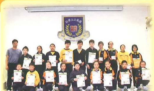
「精彩人生學生獎勵計劃」學生領獎合照

此計劃鼓勵同學積極投入學校生活，為自己設定目標，然後積極實踐，並在品德、學業、服務及課外活動等方面多元發展。同時透過讚賞和獎勵，強化學生的成功經驗，培養他們正面思維及實踐精神。