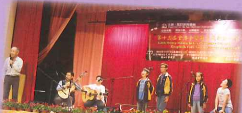
民歌隊在全港英文民歌比賽中獲取優異的成績，他們的表現出色，還獲評判邀請他們到台上作示範表演。