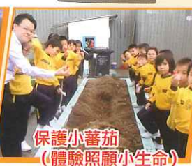
保護小蕃茄 (體驗照顧小生命)