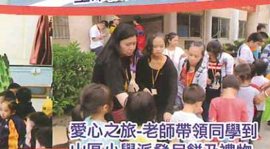
愛心之旅 - 老師帶領同學到山區小學派發月餅及禮物