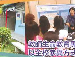
教師生命教育專業交流 - 以全校參與方式陶育學生生命價值