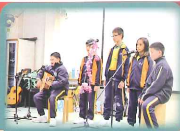
Students took part in the Sunday Smile Recording Session. They had a recording at the RTHK studio.