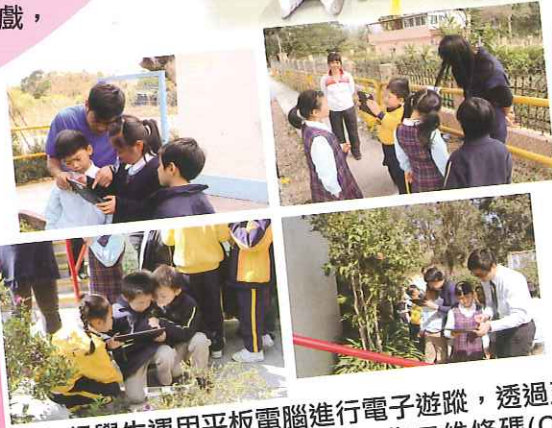
一年級學生運用平板電腦進行電子遊蹤，透過五感句描述校園的春天。學生採集二維條碼(QR code)，同學們再利用QR code看問題，並依照指示利用多媒體回答問題。