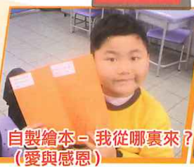
自製繪本 - 我從哪裏來? (愛與感恩)

在生命教育課中，老師透過一系列的短片、繪本故事及體驗活動，讓學生反思他人對自己的愛與照顧，並體驗如何以自己的能力去照顧生命及去愛他人。在愛家人的單元中，透過體驗式教學活動，結合自然生態，讓學生了解父母平日照顧自己的辛苦，了解自己的家庭角色，從而孝順父母，為家人服務。在糖果分享的活動中，讓學生學會愛是用心觀察，並需要付出自己所擁有的能力、物資或時間。學生從愛自己、愛他人延伸至愛護校園，使學生知道自己在不同地方的角色，履行應有的責任。