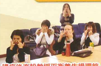
講座後亦設教授平衡養生操環節，教家長按穴位進行日常保健，希望家長能擁有健康的體魄照顧孩子。