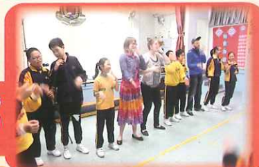
P.5 & P.6 had a surprise – a Christmas Party with Santa.