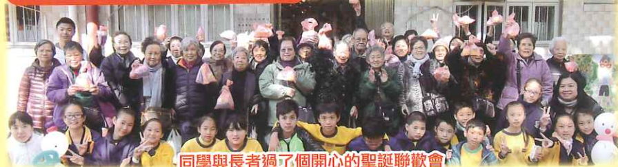
同學與長者過了個開心的聖誕聯歡會