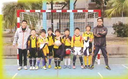
第六屆「慈慈禁毒盃」小型足球邀請賽