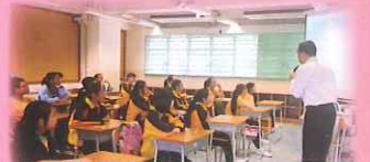
中學老師向同學講解中學課程

本學年小六同學參觀了粉嶺救恩書院、基新中學和喇沙中學，讓同學對中學校園環境、課程特色、收生要求有更多認識。