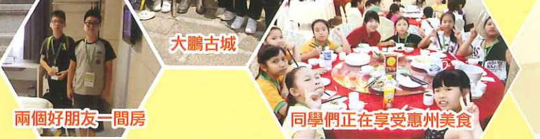
兩個好朋友一間房