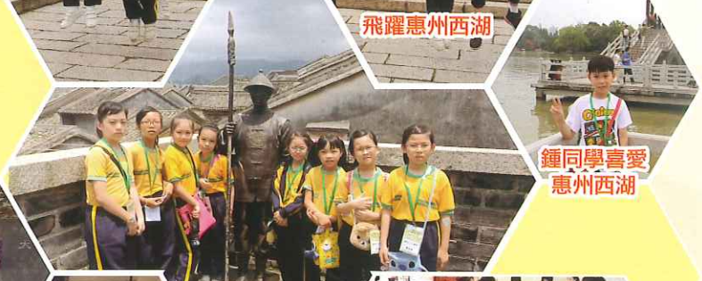
鍾同學喜愛惠州西湖