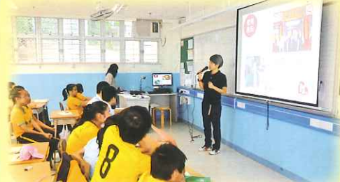
長者安居協會的職員給予學生義工訓練