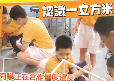
同學正在合作量度邊長