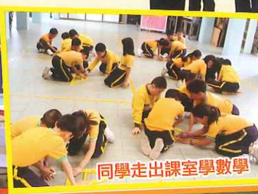
同學走出課室學數學