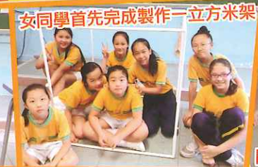
女同學首先完成製作一立方米架