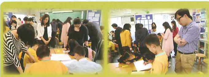
Visitors from the Education Bureau, Kindergarten, North District and Kowloon District observed a P.3 lesson – Integrating Cooperative Learning Approach in Task-based Learning.