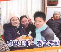
感恩生命 - 敬老活動