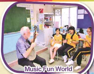
Music Fun World