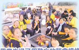
畢業生過了個難忘的營會燒烤