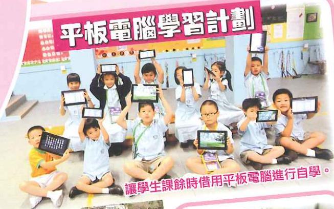
讓學生課餘時借用平板電腦進行自學。