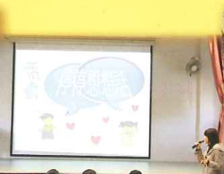
巴拿巴愛心服務團到校為學生舉辦「停停想想」禁毒活動