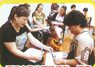
透過有趣的體驗活動，讓家長明白學生學習的難點

1. 本年度家教會舉辦了多項活動，其中「開心學堂」全年共舉辦了六次講座，講題主要圍繞如何管教子女及如何與子女建立良好的親子關係。