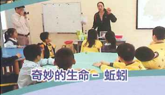
奇妙的生命 - 蚯蚓