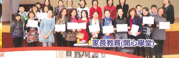
家長教育(開心學堂)