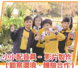
小小配音員 - 影片製作 (觀察環境、體驗合作)