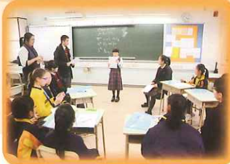
Making delicious 'Aussie' sandwiches in the Peer-Support Programme