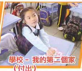
學校 - 我的第二個家 (付出)