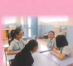
同學進行模擬小組討論