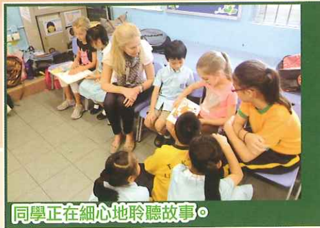
同學正在細心地聆聽故事。