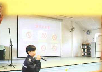
警長到校宣傳禁毒訊息