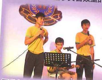
同學十分勇躍參與校內一年一度的音樂比賽。