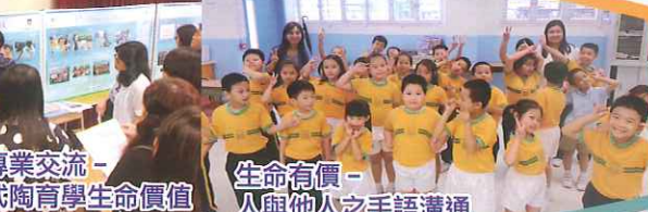
生命有價 - 人與他人之手語溝通