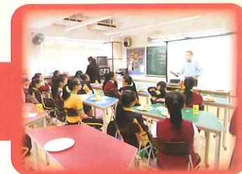
P.2 and P.3 taking part in the 2014 school Spelling Bee Competition.