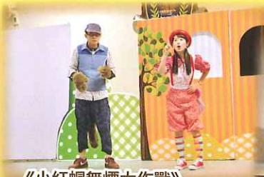
《小紅帽無煙大作戰》

學生在輕鬆愉快的氣氛下認識了吸煙和毒品的禍害，學會把訊息帶給身邊的人，建立積極健康的生活態度。