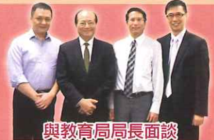
與教育局局長面談

2013-2014年度是學校三年發展計劃的第二年，學校的關注事項，首要是「提升學生學習英文的興趣及能力」，其次是「全面優化德育及生命教育，培養學生正面的人生態度及良好的品德」。