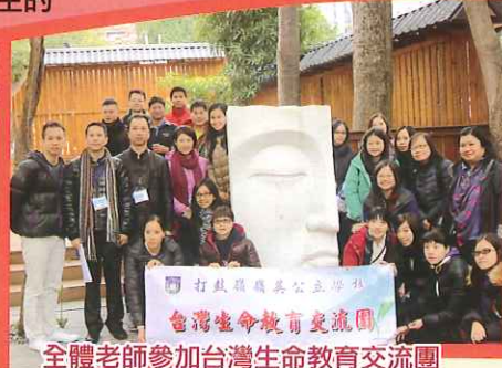
全體老師參加台灣生命教育交流團