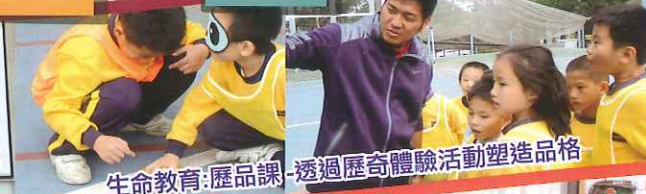
生命教育: 歷品課 - 透過歷奇體驗活動塑造品格