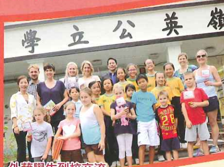
外籍學生到校交流