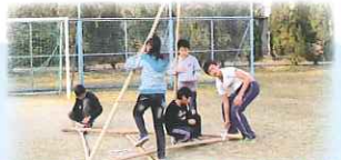
歷奇活動測試同學的解難能力