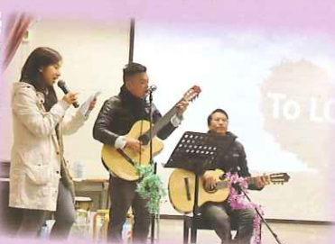
好歌獻給您：冰天的太陽

聖誕期間，校長和老師一起與同學分享英文歌曲“Christmas is a time to love”，鼓勵同學在聖誕佳節向身邊的人表達「愛」。