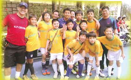
第十屆小學男子七人草地足球挑戰賽亞軍