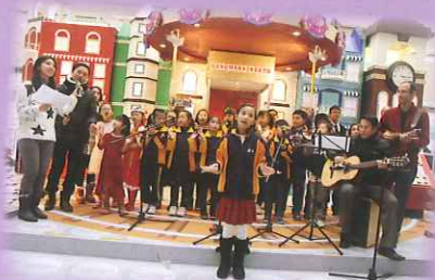
校長、老師、家長和同學們一起參與上水廣場的聖誕表演。