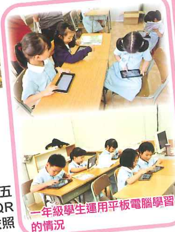
一年級學生運用平板電腦學習的情況