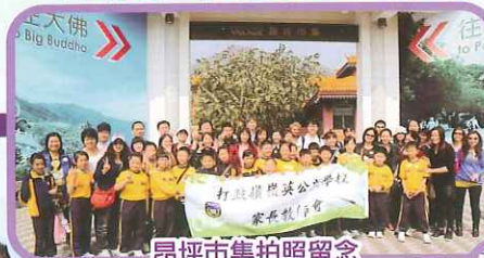
昂坪市集拍照留念

2. 親子旅行：本會於2014年3月22日舉行親子旅行，遊覽大澳水鄉、昂坪市集及天壇大佛。是次活動得到家長踴躍參與，參加人數超過200人！大家都盡興而歸。非常感謝出席家長和學生支持呢！在家長問卷調查中，大部份家長都滿意整個活動的安排。