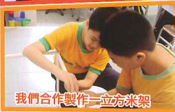
我們合作製作一立方米架