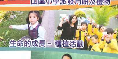
生命的成長 - 種植活動