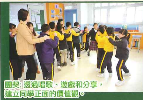
團契：透過唱歌、遊戲和分享，建立同學正面的價值觀。