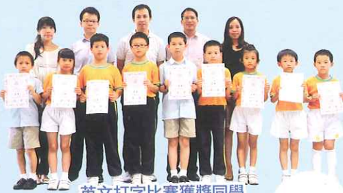
英文打字比賽獲獎同學

為了推動資訊科技教學，本校引入了電子平板的學習計劃，同學們利用平板電腦進行學習，到戶外拍照及進行遊蹤活動，提高學生應用資訊科技的能力。另外，電腦科亦舉辦了不同的活動，例如：聖誕賀卡設計比賽、相片編輯設計比賽、英文打字比賽及漢語拼音打字比賽，通過各種活動，提高學生學習興趣。