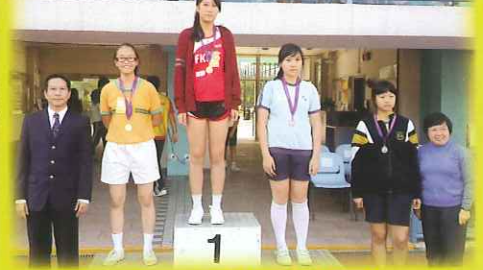
學界田徑比賽成績優異