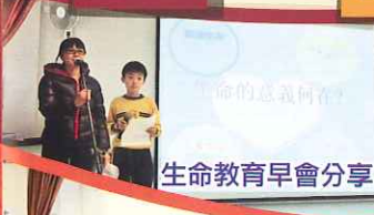
生命教育早會分享