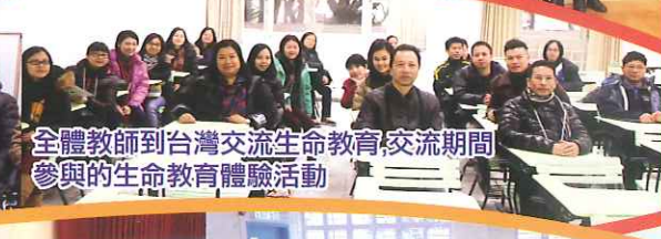
全體教師到台灣交流生命教育, 交流期間參與的生命教育體驗活動