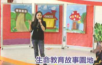
生命教育故事園地