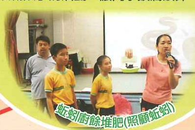
蚯蚓廚餘堆肥(照顧蚯蚓)