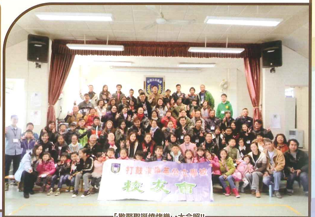
「歡聚聖誕燒烤樂」大合照!!