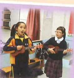
她們正在自彈自唱，樂趣無窮。

3A班同學在音樂課堂中學習夏威夷小結他。 1. 為培養學生對音樂的興趣，達至一生一體藝的目的，本校特別在小二至小四的常規音樂課中加入夏威夷小結他(Ukulele)課程。