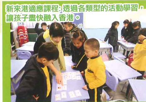
新來港適應課程：透過各類型的活動學習，讓孩子盡快融入香港。