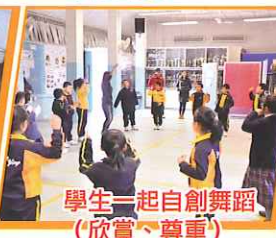
學生一起自創舞蹈 (欣賞、尊重)