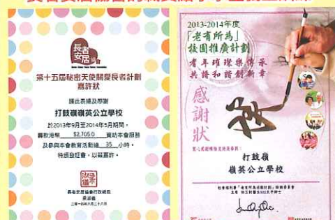
「老有所為」校園推廣計劃感謝狀