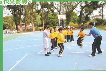
花式跳繩隊：同學落地地跳，校友也來參與。