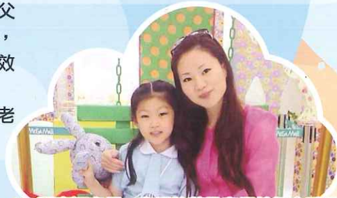
(3A張嘉穎家長、家長校董及家長教師會委員)